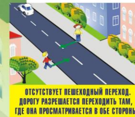
ОТСУТСТВУЕТ ПЕШЕХОДНЫЙ ПЕРЕХОД. ДОРОГУ РАЗРЕШАЕТСЯ ПЕРЕХОДИТЬ ТАМ, ГДЕ ОНА ПРОСМАТРИВАЕТСЯ В ОБЕ СТОРОНЫ