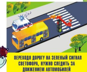
ПЕРЕХОДИ ДОРОГУ НА ЗЕЛЕНЫЙ СИГНАЛ СВЕТОФОРА, НУЖНО СЛЕДИТЬ ЗА ДВИЖЕНИЕМ АВТОМОБИЛЕЙ