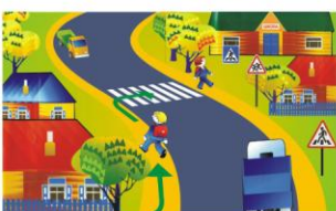
ПО ОБОЧИНЕ ДОРОГИ СЛЕДУЕТ ИДТИ НАВСТРЕЧУ ДВИЖЕНИЮ ТРАНСПОРТА