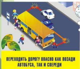
ПЕРЕХОДИТЬ ДОРОГУ ОПАСНО КАК ПОЗАДИ АВТОБУСА, ТАК И СПЕРЕДИ