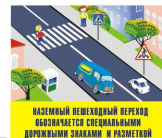
НАЗЕМНЫЙ ПЕШЕХОДНЫЙ ПЕРЕХОД ОБОЗНАЧАЕТСЯ СПЕЦИАЛЬНЫМИ ДОРОЖНЫМИ ЗНАКАМИ И РАЗМЕТКОЙ

Вот обычный переход. По нему идёт народ. Здесь специальная разметка, «Зеброю» зовётся метко! Белые полосы тут Через улицу ведут! Знак «Пешеходный переход» Где на «зебре» пешеход, Ты на улице найди И под ним переходи!